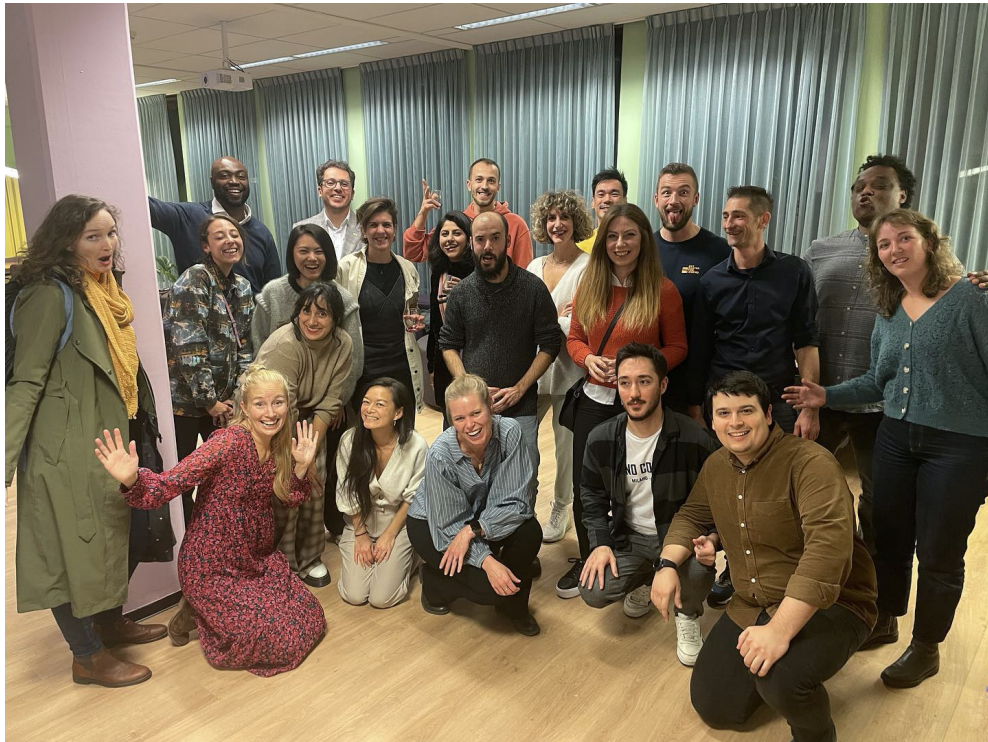
Afbeelding 1: TechMeUp vierde haar 2-jarig bestaan met de studenten.